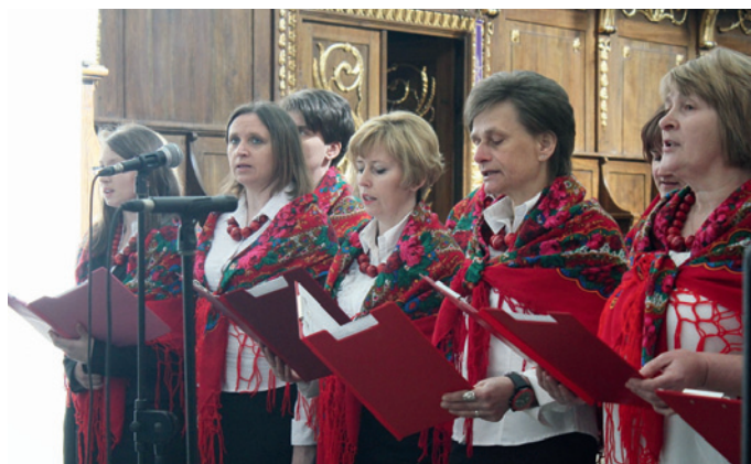
Zespół Modrzewianki podczas przeglądu.