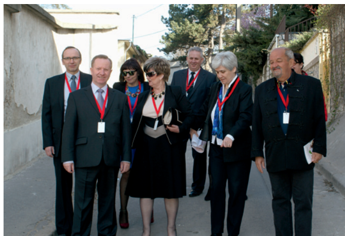
Delegacja gminy Nowa Słupia i XX Dzielnicę Budapesztu.

Samorządowcy z Nowej Słupi podkreślają, że wszędzie widoczna była serdeczność. Węgrzy naprawdę dbają o swoich przyjaciół i nie są to wymuszone kontakty, dyplomatyczne. Jest w nich autentyczny humor, uśmiech, wzajemne dobre relacje.