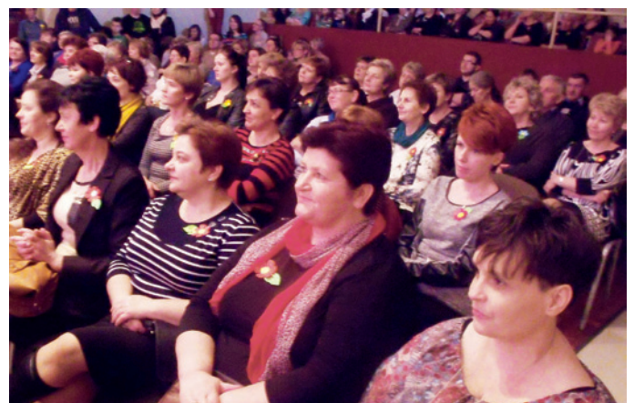
Panie były zachwycone występem panów.