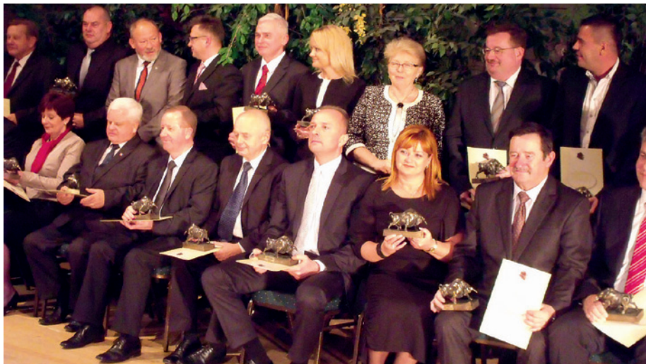
Laureaci plebiscytu Top Manager tuż po rozdaniu statuetek.

Podczas przyznawania nagród podkreślano ze sceny, że Nowa Słupia, mimo rolniczego charakteru, należy do czołówki gmin regionu świętokrzyskiego pod względem tempa rozwoju. Potwierdzają to nagrody w konkursach ogólnopol-