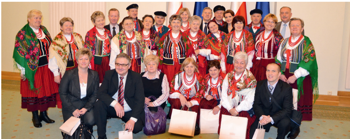
Chełmowianki oraz delegacja z gminy Nowa Słupia podczas wizyty w Pałacu Prezydenckim w Warszawie.