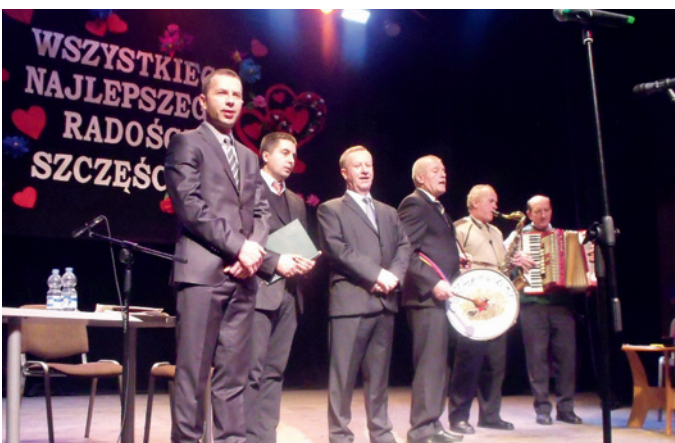
Panowie odśpiewali paniom „Sto lat”.