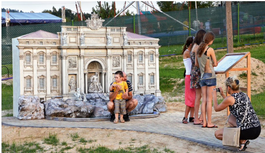
Park miniatur w Krajinie przyciąga turystów nawet z odległych regionów Polski.

Jedyny w województwie park miniatur, w którym można zobaczyć najśłynniejsze budowle świata powstał w Krajinie-Zagórz