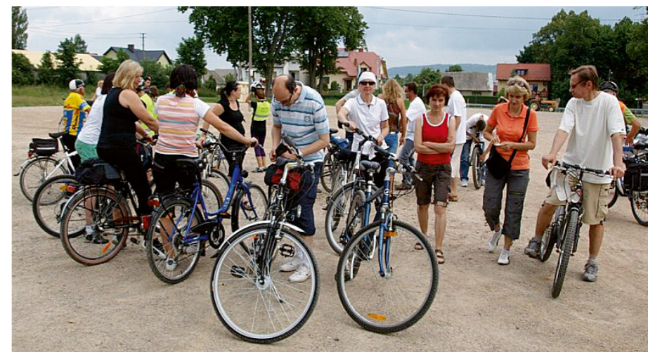
W rajdzie wzięło udział blisko czterdziestu cyklistów z różnych gmin naszego powiatu.

nikom rajdu sprawili ochotnicy z Woli Jachowej, którzy z chętnymi pływali łodzią motorową po zalewie. Był też konkurs z nagrodami dla uczestników rajdu. J.S.