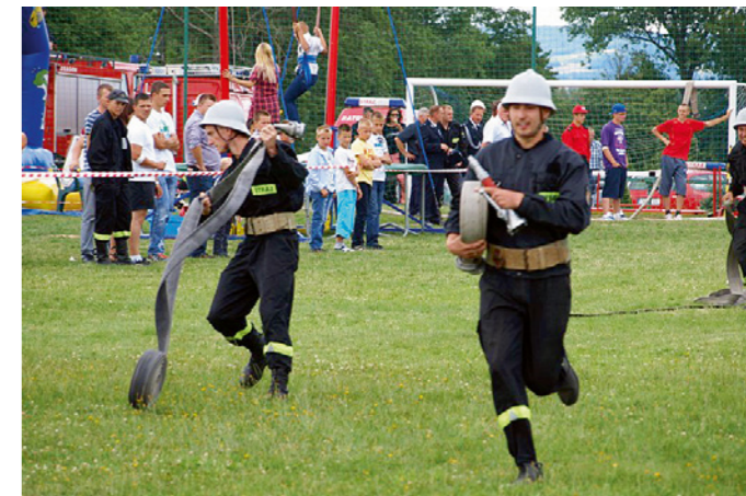
Zawody strażackie wygrali ochotnicy z Woli Jachowej.

G minne Zawody Sportowo-Pożarnicze o Puchar Wójta Gminy Górno rozegrane. Tłumy mieszkańców bawili się podczas festynu z okazji otwarcia świetlicy wiejskiej i ścieżki zdrowia w Woli Jachowej.