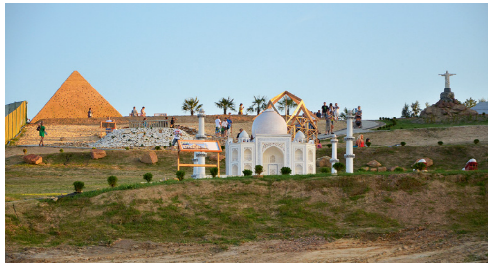
... najslawniejsze budowle Afryki, Azji i Ameryki...

wanie mediów i turystów. Już dzień po otwarciu z ośrodka Sabat w Krajinie był nadawany program Radia Kielce – Kapsuła Czasu.