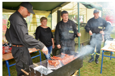
Strażacy serwowali grochówkę i kielbasę z grilla.

Nie zabrakło także konkursów z nagrodami. Z każdą godziną impreza nabierała tempa, a widownia coraz żywiej reagowała na to co się działo na scenie. Niemal do też rozbawił wszystkich śląskimi szlagierami zespół Bajery. Po nim na scenie pojawiła się gwiazda wieczoru – Power Play. Taneczna zabawa, którą zapoczątkowała ta grupa przeobraziła się w dyskotekę pod gwiazdami, która trwała do późnych godzin wieczornych.