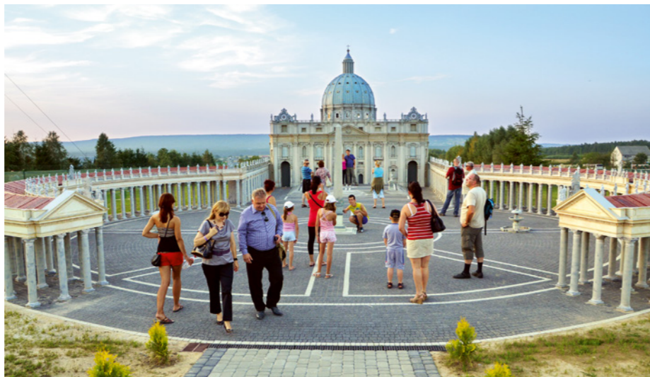
Odwiedzając ośrodek Sabat w Krajinie można znaleźć się na Placu Świętego Piotra w Rzymie....

Najtańszy bilet do parku linowego kosztuje 10 złotych. Osoby chcące pokonać wszystkie trasy muszą kupić wejściówkę za 60 złotych. By zwiedzić Aleję Miniatur trzeba zapłacić 15 (ulgowy) lub 20 złotych. Zwiedzanie odby-