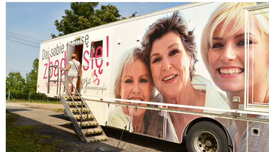
W bezpłatnych badaniach mammograficznych w sierpniu wzięło udział ponad czterdzieści mieszkank gminy Górno.

zarejestrować się oraz uzyskać informację o tym kiedy znów mammobus pojawi się w naszej gminie.