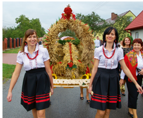
Najładniejszy wieniec dożynkowy wykonany przez mieszkańców Skorzeszyc.

Kilkaset osób wzięło udział w „Ludowym festynie integracyjnym” połączonym z dożynkami, który odbył się 26 sierpnia w Górnem. Gwiazdą imprezy był zespół Power Play. Na uczestników czekała też cała masa innych atrakcji.