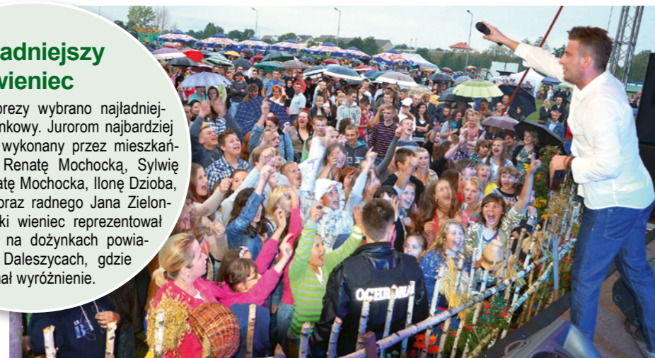
Wspaniałą zabawę zapewnił uczestnikom dożynek zespół Power Play.