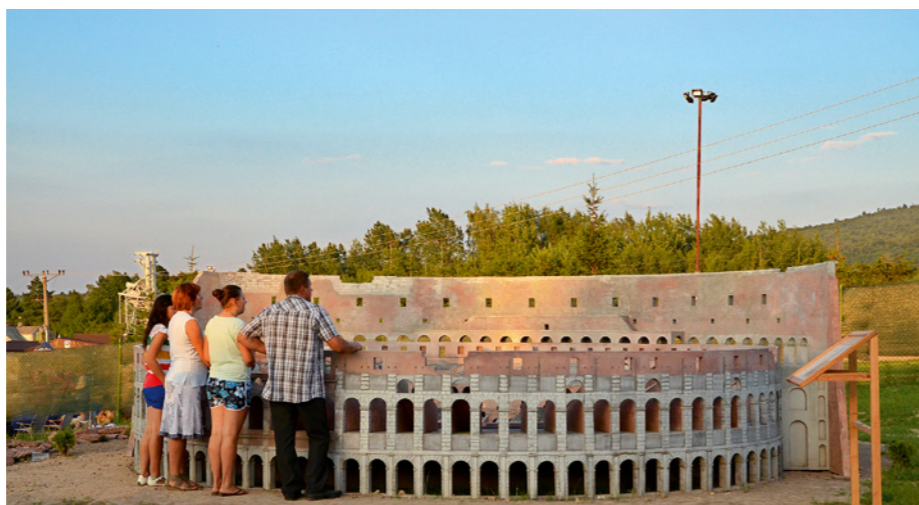
... zobaczyć słynne Koloseum...

wa się codziennie w godzinach 10-20. Park miniatur oraz park linowy powstały przy wsparciu finansowym Unii Europejskiej i wzbudzają duże zaintereso-